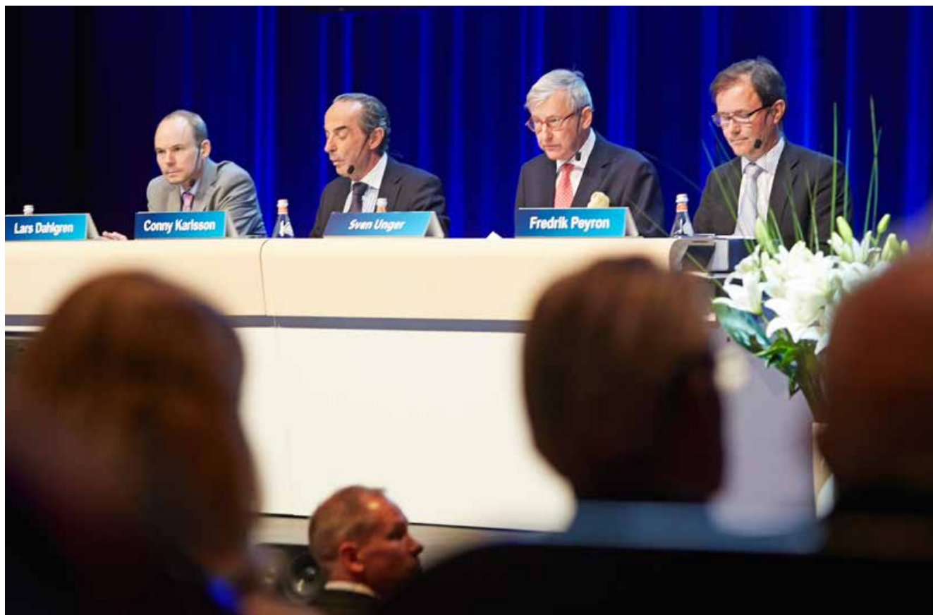
Swedish Match årsstämma 2014.

Under 2014 utgjordes rapporteringskommitténs ledamöter av cheferna för Business Control, Investor Relations and Corporate Sustainability, Group Reporting and Tax samt Corporate och Legal Affairs.