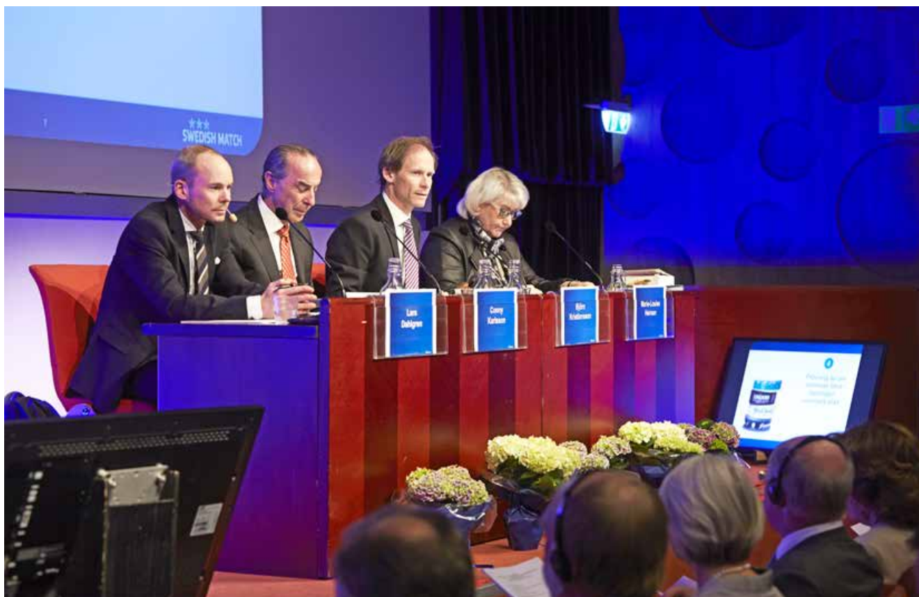
Swedish Match årsstämma 2015.

Under 2015 utgjordes rapporteringskommitténs ledamöter av cheferna för Business Control, Investor Relations and Corporate Sustainability, Corporate Control samt Legal Affairs.